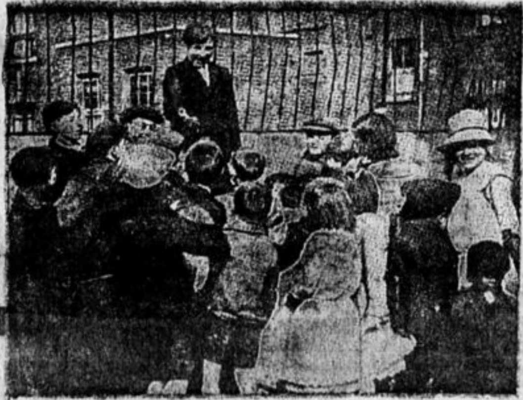
Митинг английской деткоморганизации.

Английские капиталисты широко пользуются детским трудом. В